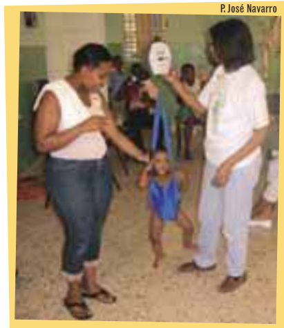
Día de la Celebración de la Vida en una comunidad en la República Dominicana

El Día de la Celebración de la Vida es el momento en que las comunidades reúnen a sus niños y niñas, acompañados por uno o más miembros de las familias, para ser pesados. Este momento de fraternidad es enriquecido con el intercambio de experiencias, información y es compartida una deliciosa merienda.