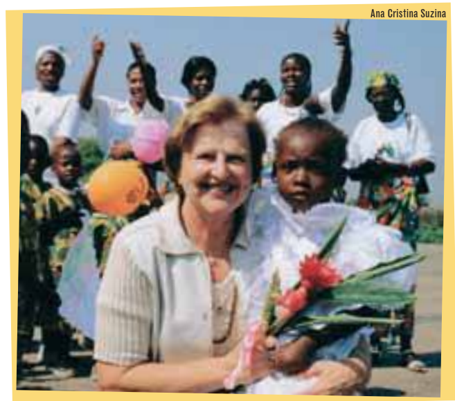
Dr. Zilda Arns Neumann en visita a Angola en 2002

Aprobada la propuesta, la Conferencia Nacional de Obispos de Brasil (CNBB) indicó al entonces Arzobispo de Londrina, Don Geraldo Majella Agnelo, actualmente Cardenal Principal de San Salvador de Bahía, para acompañar el desarrollo del trabajo. El lema escogido fue “Para que todos los niños y las niñas tengan vida, y la tengan en abundancia” (Jo 10,10). El proyecto piloto fue implantado en Florestópolis, municipio que pertenece a la