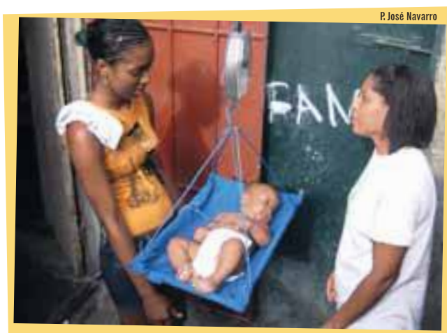
Lider comunitaria pesando un bebé en la República Dominicana

En Brasil en 43.000 comunidades se pesan cada mes los niños y niñas.