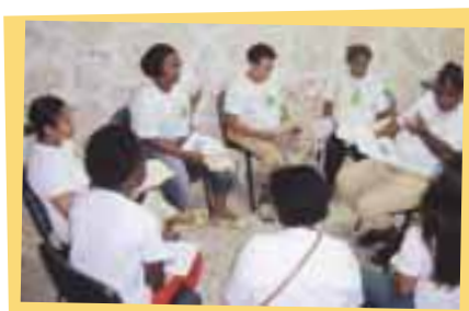
Reunión de Reflexión y Evaluación en la República Dominicana

El peso de cada niño o niña es registrado en la Tarjeta del Niño y en el Cuaderno del Líder. La información llega hasta la Coordinación Nacional de la Pastoral del Niño y de la Niña, donde es digitada y se transforma en un importante indicador de la salud y del bienestar.