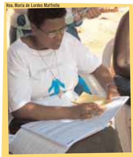
Líder Comunitaria en Guinea-Bissau con el Cuaderno del Líder

La cuchara-medidora de suero casero indica las cantidades de sal y azúcar que de deben ser adicionados a un vaso de 200 mililitros (ml) de agua limpia. La preparación del suero, siguiendo el folleto