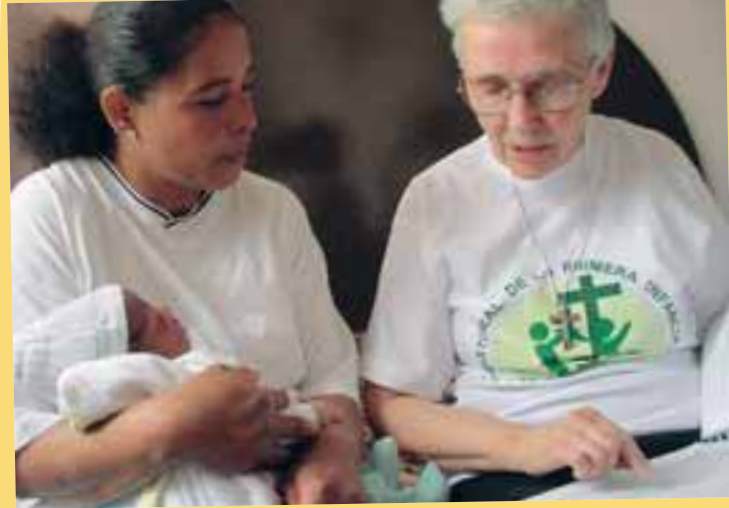
Visita domiciliar de líder Comunitaria en Colombia

visitas, el líder tiene la posibilidad de conocer mejor a la familiar y compartir conocimientos y experiencias sobre salud, nutrición, higiene, ciudadanía, gestación, prevención de enfermedades, educación infantil, entre otros asuntos. El líder también analiza que es lo que puede ser mejorado en el cuidado de los niños y las niñas, en la gestación, en la alimentación y en la convivencia familiar.