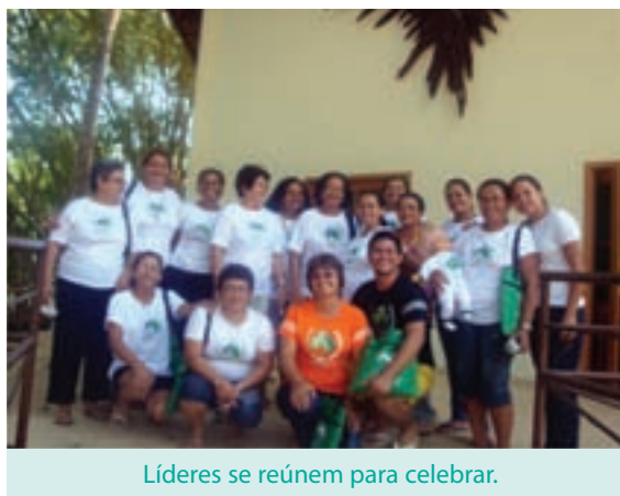
Líderes se reúnem para celebrar.

Aconteceu, também, a capacitação para capacitadores em Saúde Bucal, Alimentação Saudável e Hortas Caseiras, Brinquedos e Brincadeiras. Em todos os ramos muitas ações importantes aconteceram. Na Paróquia São Sebastião, de Rio Branco, aconteceram os encontros de grupos de gestantes, capacitação em saúde bucal e brinquedos e brincadeiras dentre outras ações. A Paróquia Bom Jesus, de