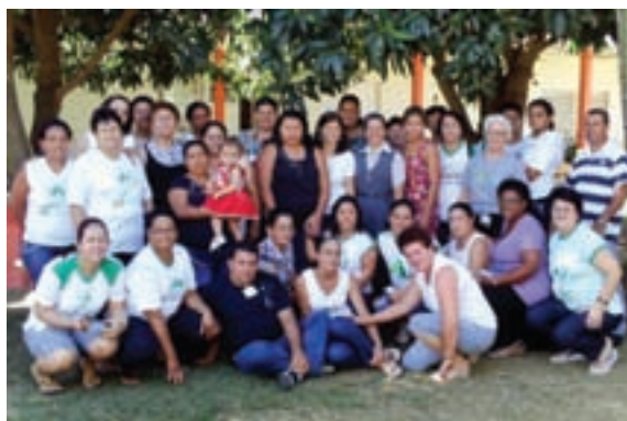
Líderes animados com a missão da Pastoral da Criança.

Em 2009, realizamos a Assembleia Diocesana, que contou com a participação dos Ramos. Durante a assembleia foi feita a