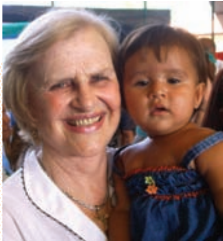
Dra. Zilda Arns Neumann Fundadora e Coordenadora Internacional da Pastoral da Criança. Fundadora e Coordenadora Nacional da Pastoral da Pessoa Idosa. Conselheira do Conselho de Desenvolvimento Econômico e Social da Presidência da República.

Querida(o) Líder Querido(a) Coordenador(a)