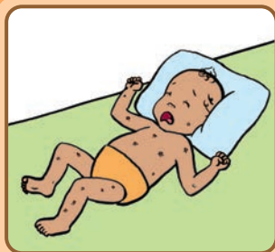
Anpil bouton (zanpoud) ak pi sou kò tibebe a