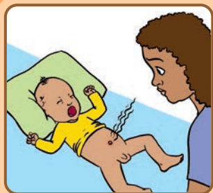
Lonbrit rouj k-ap bay pi